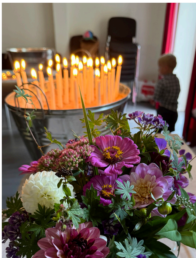
Ljus tända av deltagare på minnesstunden på familjehelgen.